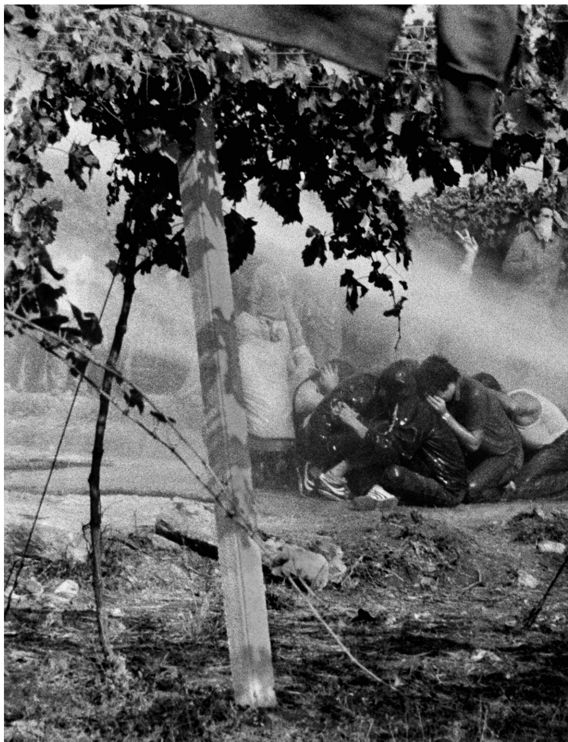
1. Manifestazione per la pace a Comiso: la polizia carica con gli idranti, 11 Ottobre 1981, Archivio Centro di studi e iniziative culturali Pio La Torre.