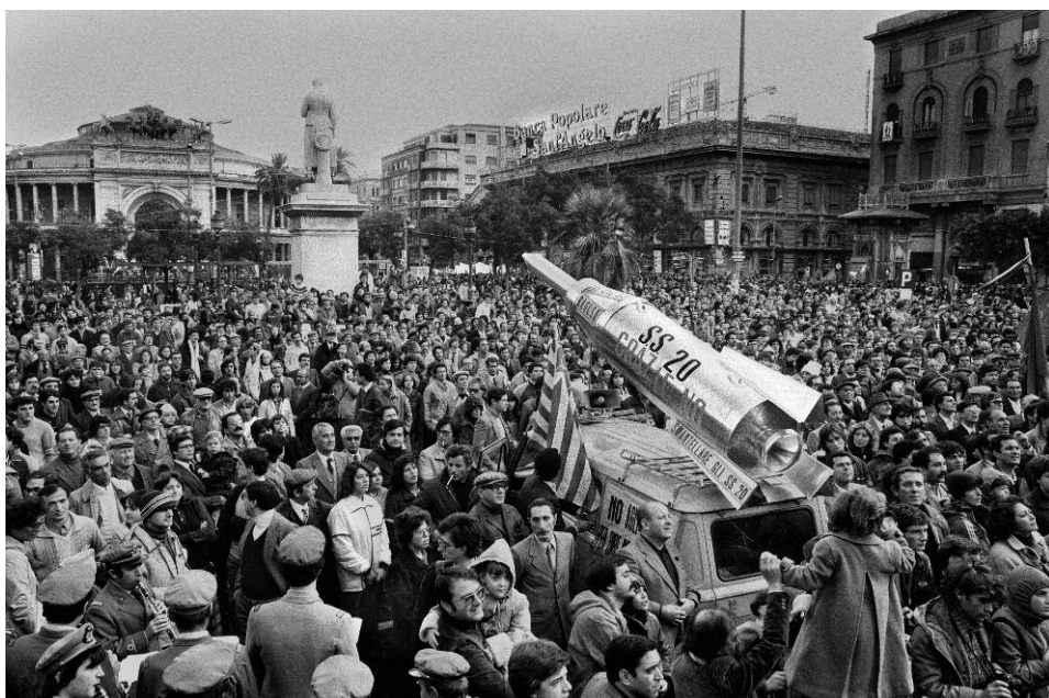
4. Manifestazione sindacale per la pace, 29 novembre 1981, piazza Politeama, Palermo, Archivio Centro di studi e iniziative culturali Pio La Torre.