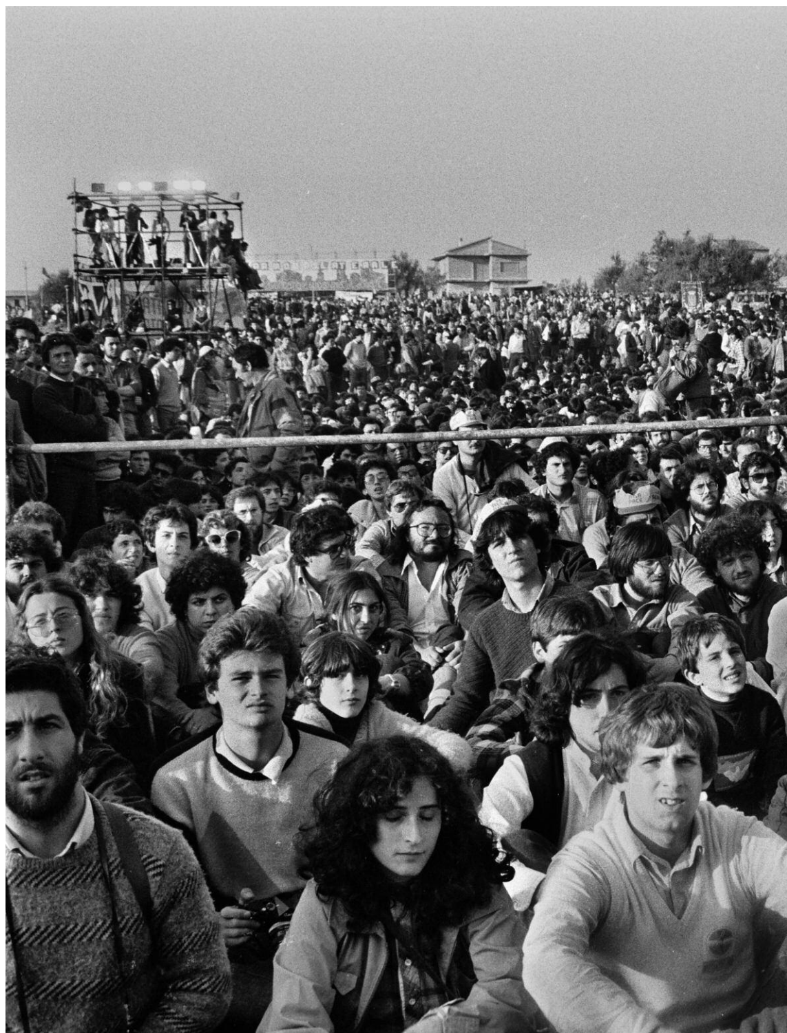
5. Manifestazione per la pace, 4 aprile 1982, Comiso, Archivio Centro di studi e iniziative culturali Pio La Torre.