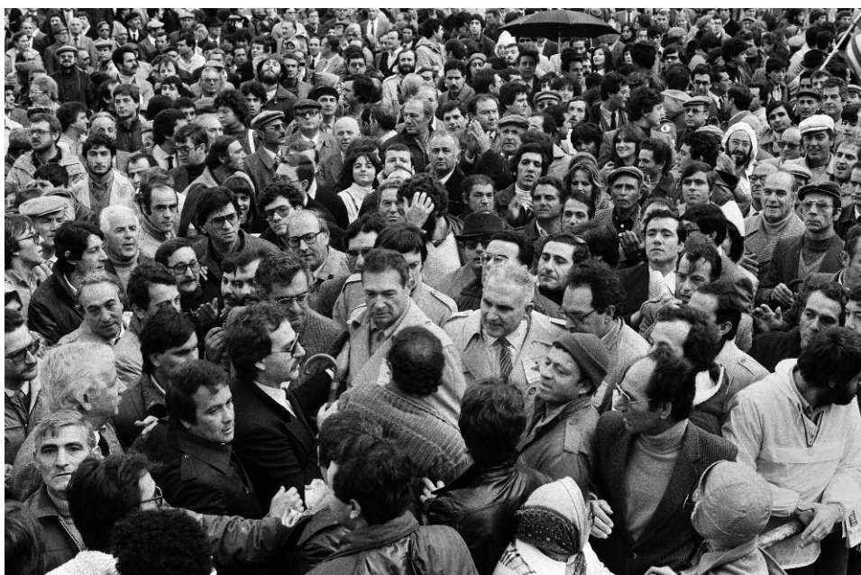
3. Manifestazione sindacale per la pace con La Torre e Lama, 29 novembre 1981, piazza Politeama, Palermo, Archivio Centro di studi e iniziative culturali Pio La Torre.