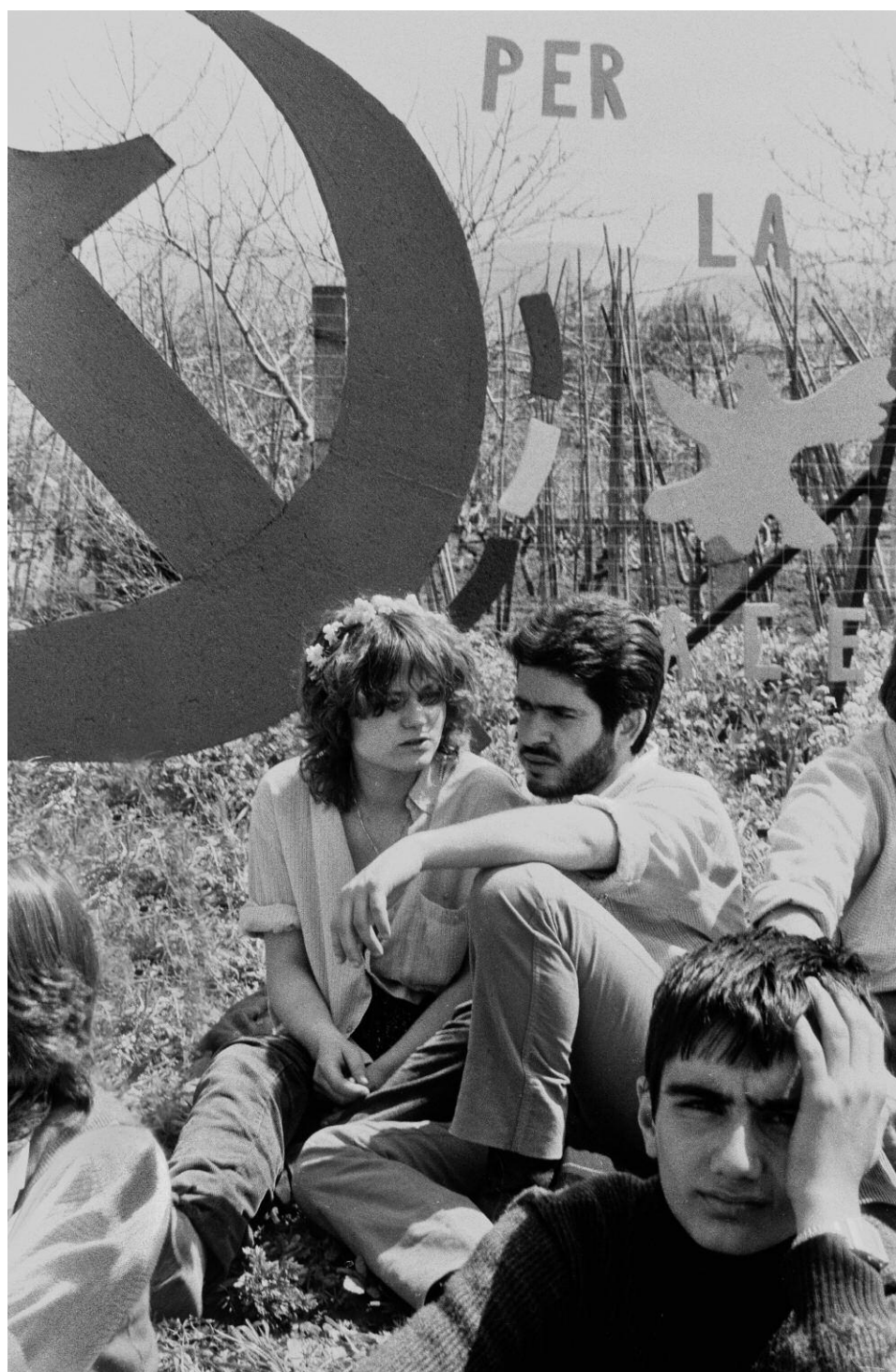
2. Giovani a Comiso, Archivio Centro di studi e iniziative culturali Pio La Torre.